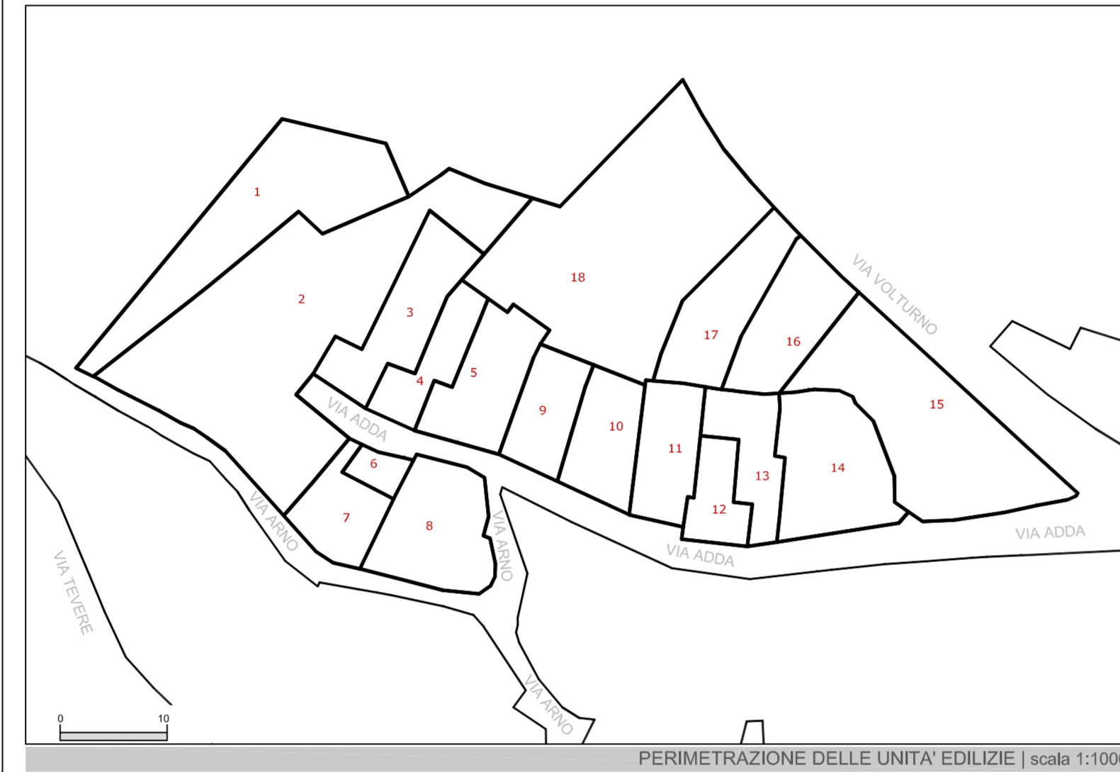
PERIMETRAZIONE DELLE UNITA' EDILIZIE | scala 1:1000

ISOLATO DI ANALISI LIMITE CENTRO MATRICE - Del. RAS n°516/D.G. 17/03/2009 LIMITE CENTRO STORICO - D.C.C. n°56 del 14/09/1996