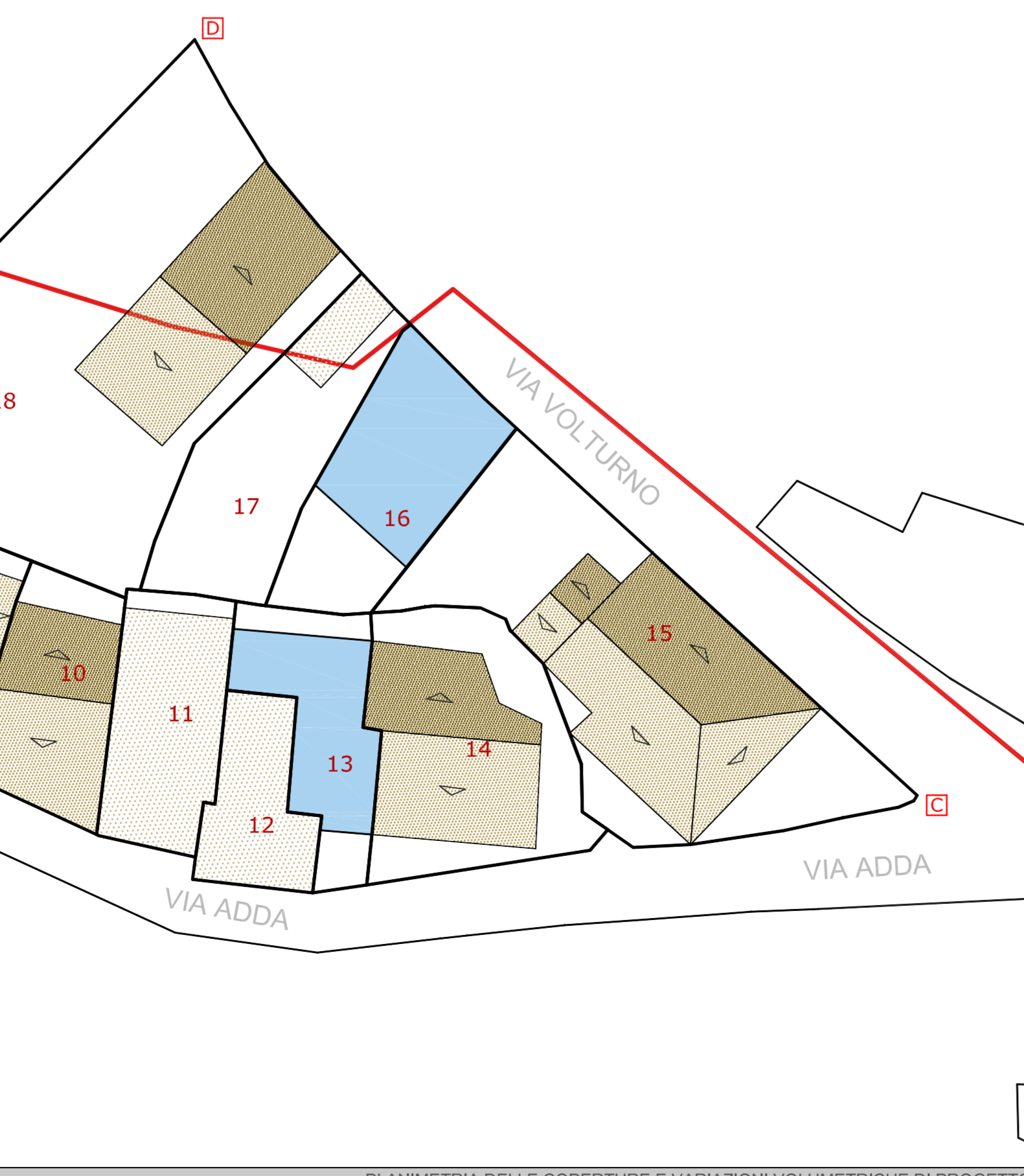
PLANIMETRIA DELLE COPERTURE E VARIAZIONI VOLUMETRICHE DI PROGETTO