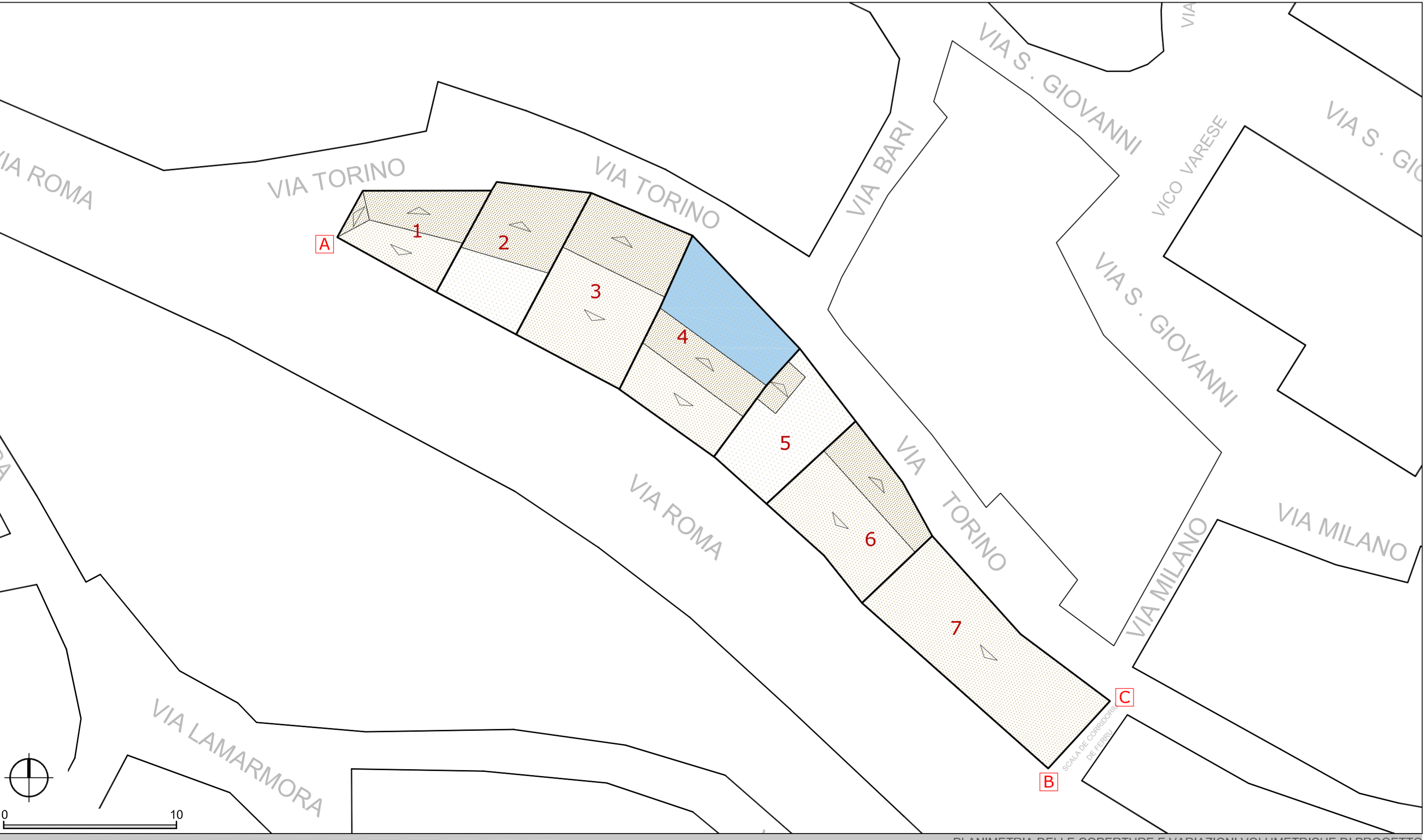
PLANIMETRIA DELLE COPERTURE E VARIAZIONI VOLUMETRICHE DI PROGETTO