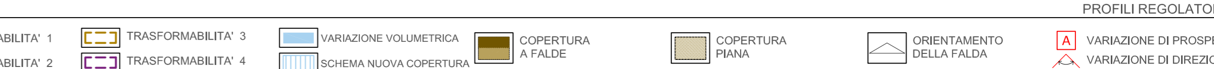
PROFILI REGOLATORI - STATO DI PROGETTO