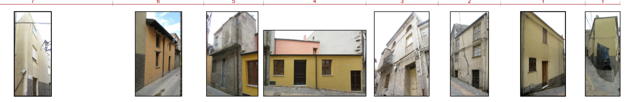
PROFILI REGOLATORI - STATO DI FATTO